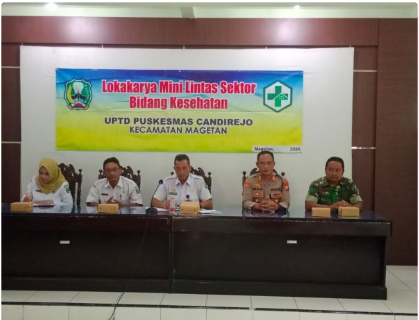
Bati TUUD Koramil 0804/01 Magetan Hadiri Loka Karya Mini Lintas Sektor Tri Bulanan Bidang Kesehatan

MAGETAN. - Bati TUUD Koramil Tipe B 0804/01 Magetan Kodim Magetan Pelda